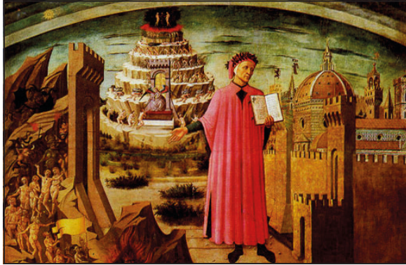
DOMENICO DI MICHELINO, La Divina Commedia di Dante (1465). Duomo di Firenze.