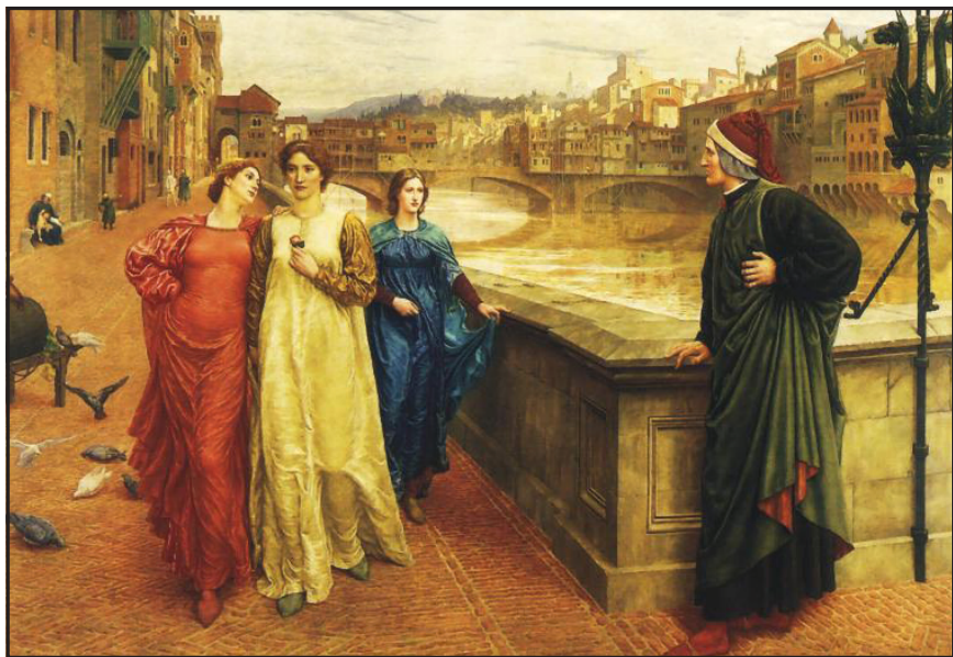
HENRY HOLIDAY, l’incontro immaginario fra Dante e Beatrice (con il vestito bianco) accompagnata dall’amica Vanna (con il vestito rosso), sul Ponte Santa Trinità in Firenze (1883)